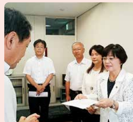
教育長に申し入れる議員団

教育長答弁では、「9月中に空調設備導入支援業務委託に着手し、導入手法も検討し、スケジュールも決定していきたい」としました。学校衛生基準が定めた普通教室の室温は、17℃～28℃となっています。引き続き、一刻も早い対応を求めていきます。