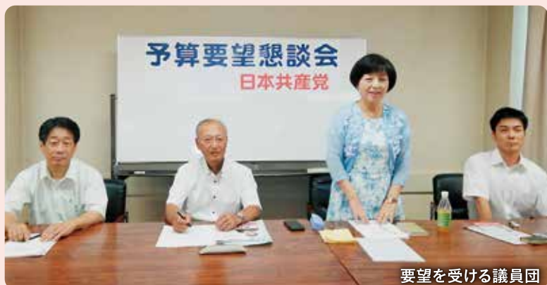
要望を受ける議員団

8月4日、姫路市市民会館において2019年度へ向けて予算要望懇談会が開催されました。参加者からは市政に対する各方面の要望がありました。これらの要望事項は議員団として要望書としてとりまとめ、10月24日から始まる各局との予算編成に対する会派要望で実現を迫ります。