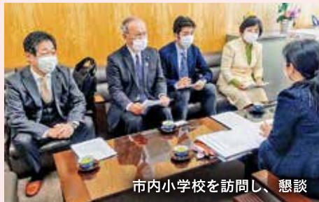
市内小学校を訪問し、懇談

国立感染症研究所のマニュアルを参考に患者発生時などの初期対応マニュアルを整備している。市医師会の協力を得て市内医療体制の確保、市民向けの予防策の広報、3回線の臨時電話増設で8時35分から21時までコールセンターの開設、ホームページ、ケーブルテレビなどで情報発信に努める。市役所の備蓄マスクは市内総合病院へ提供した。財政的な裏付けは、11年前の新型インフルエンザ発生以来、臨時対応予算を確保しており、当面はこれを活用している。と答弁しています。