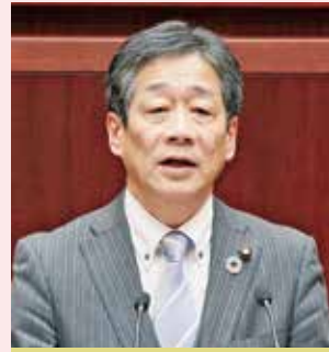
村原もりやす議員